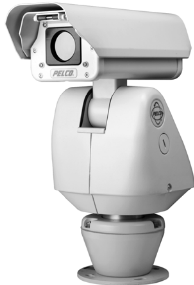
SISTEMA DE IMAGENS TÉRMICAS ES30TI ESPRIT (MOSTRADO COM SUPORTE DE PEDESTAL)

Uma construção de alumínio pintado a pó torna a Série ES30TI ideal para aplicações em ambiente interno ou externo. O sistema possui uma faixa de temperatura de operação absoluta de -50 a 140°F (-45 a 60°C). Dentro de duas horas de aquecimento, a unidade pode descongelar-se por inteiro e ser operada a partir de uma temperatura de -13°F (-25°C).